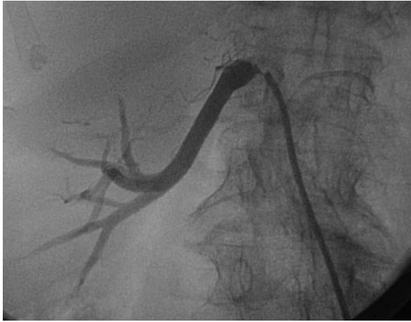
Figura 1: Lesión severa ostial en arterial renal derecha