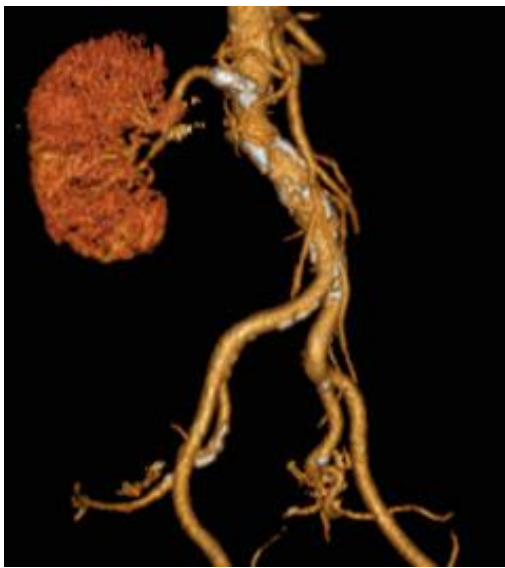
Figura 2: Angiotomografía renal: reestenosis del stent