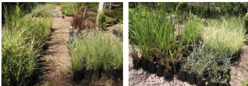
Ensayo de división de matas en otoño (izquierda) y en primavera (derecha) de 2007.

Las plantas se dispusieron en 5 bloques al azar, con 5 ejemplares provenientes de cada planta madre, logrando un total de 25 plantas para cada época ensayada.