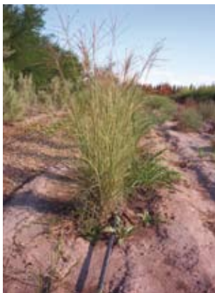
M. sinensis "Morning Light"