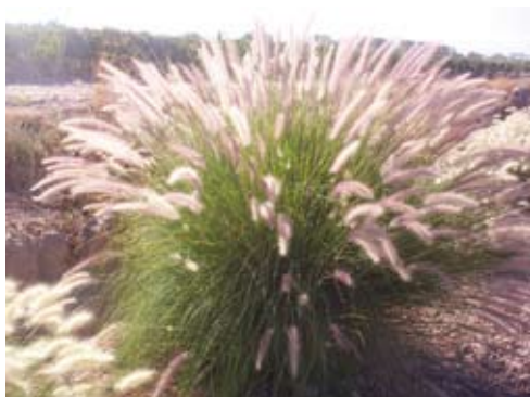
Pennisetum setaceum ( P. ruppelii )