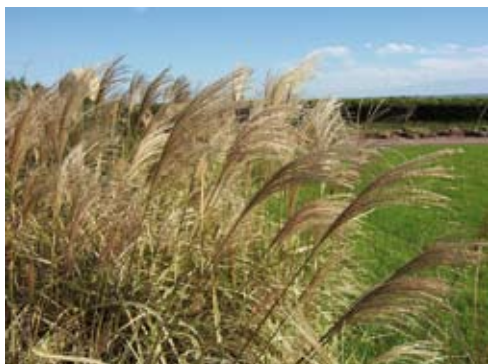
Miscanthus sinensis "Variegatus"

Las especies estudiadas fueron Miscanthus sinensis "Variegatus", M. sinensis "Zebrinus" y M. sinensis "Morning Light", Paspalum haumanii , Leymus arenarius , Pennisetum setaceum ( P. ruppelii ) y Trichloris crinita .