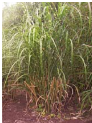
M. sinensis "Zebrinus"