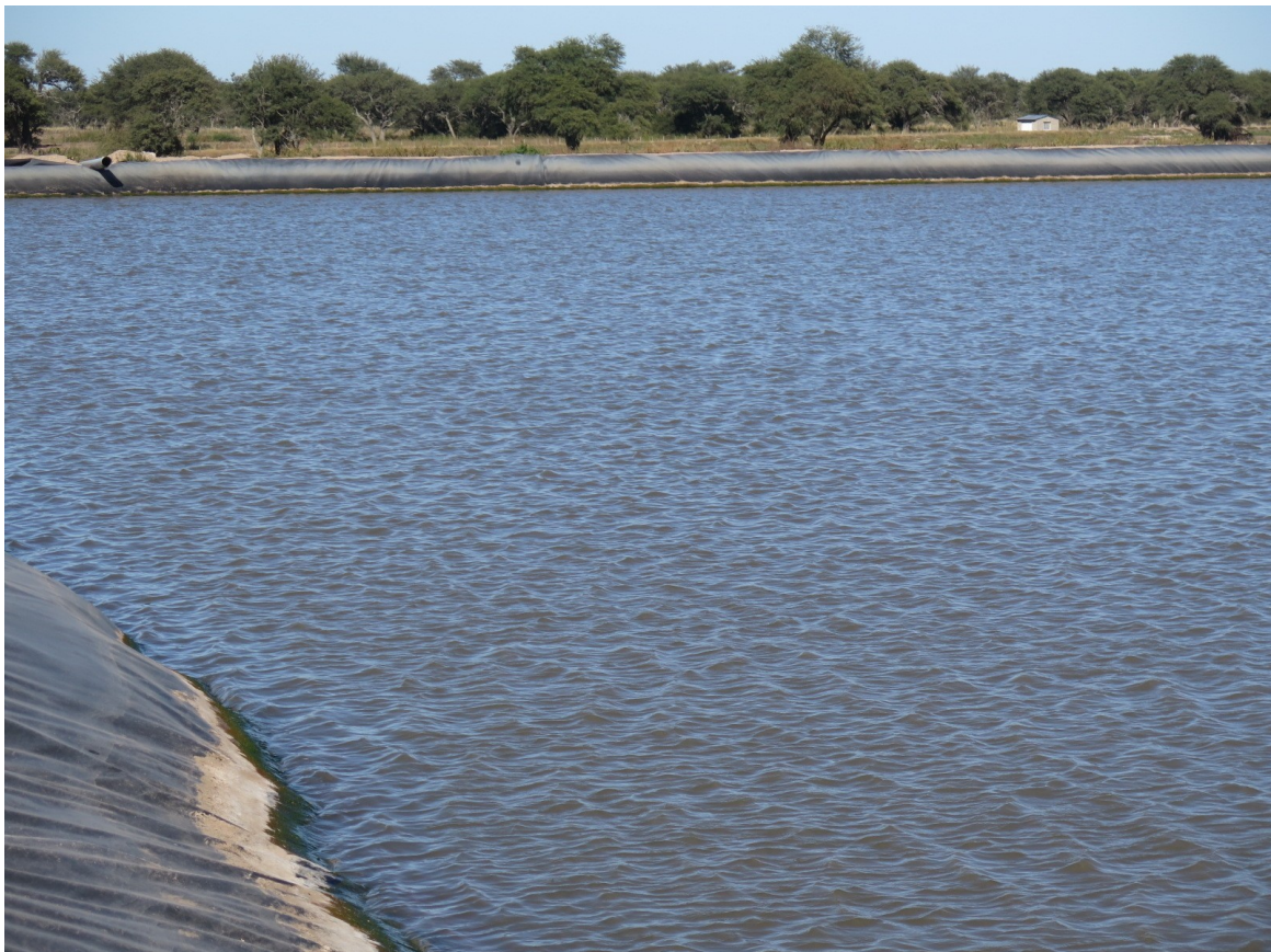
Fotografía 2. Vista desde la represa impermeabilizada. En el margen superior izquierdo se observa el ingreso del acueducto a la represa y a la derecha se observa la casilla de la bomba.