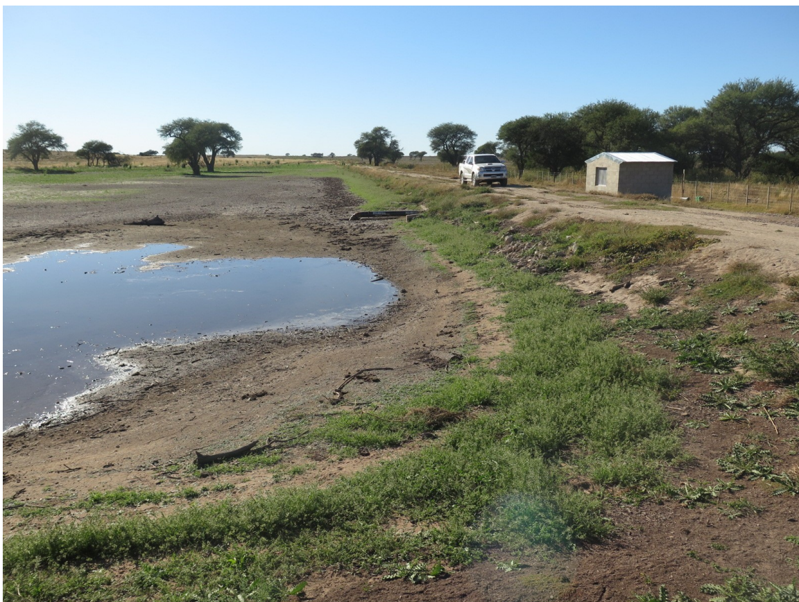
Fotografía 1. Vista parcial del tajamar (extremo SE), uno de los canales de ingreso y la toma de agua de la bomba.

Se considera que estas opciones deben tenerse en cuenta en futuros proyectos o como propuesta en lugares donde la posibilidad de agua subterránea, no es factible por falta de volumen o calidad.